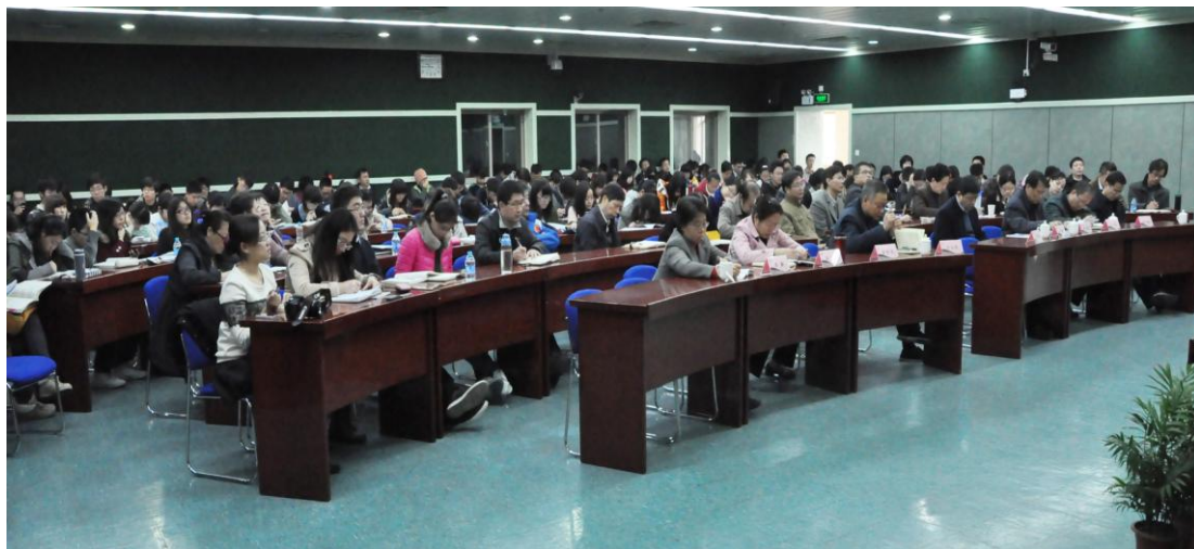
学校及各部门领导、师生代表聆听宣讲