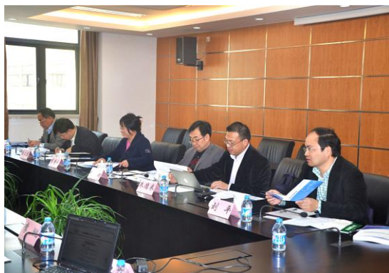
产经智库专家咨询会上专家发言

对于产经智库的研究选题：专家认为，选题要紧扣中央精神和文件，回应当下热点难点问题，并结合每位专家自身的研究成果，这样才能形成自身研究优势。专家们在具体选题内容上也给出了众多方案，如自贸区研究、上海的产业转型问题研究，关于新经济问题的研究、商业渠道对产业的带动研究等。