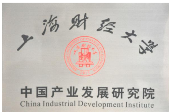
中国产业发展研究院

中国产业发展研究院是以中国特定时期的经济发展模式和产业结构转型为主攻方向，以上海在全国经济改革发展中的特定地位为出发点，立足上海，面向全国。以基础理论研究为依托，战略发展研究为导向，现实问题研究为重点，开放协同研究为模式。形成决策影响力、社会影响力、学术影响力，打造国内一流产业经济智库。