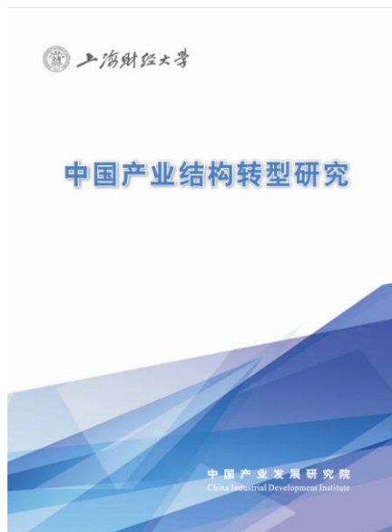
《中国产业结构转型研究》封面

《中国产业结构转型研究》论文集的编印旨在与国内同行分享产经智库的成果，互相学习、借鉴与交流，从而为中国产业发展的理论与实践做出应有的贡献。