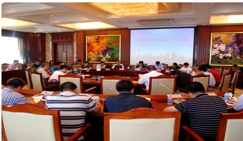
上海市高校智库建设交流座谈会