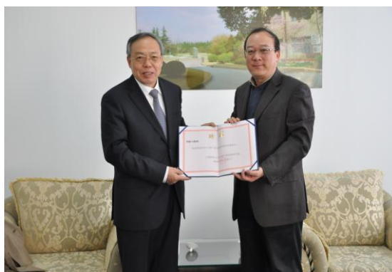
郑新立同志接受中国产业发展研究院

2013 年 11 月 26 日上午，国际经济交流中心常务副理事长、中共中央政策研究室原副主任郑新立同志受邀担任中国产业发展研究院名誉院长。上海财经大学党委书记丛树海会见了郑新立同志。科研处、党委宣传部、中国产业发展研究院等部门基地负责人参与会见。