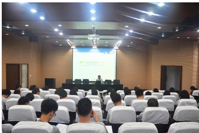
上财暑期夏令营学生认真聆听干春晖院长的演讲

本次演讲立足于中国经济转型与产业升级的迫切性与重要性，深入阐述了全球价值链分工与我国的价值链“低端锁定”、要素价格不断上升与动态比较优势“断档”以及中国崛起与“中国模式”问题，据此提出应以开放国内市场战略、